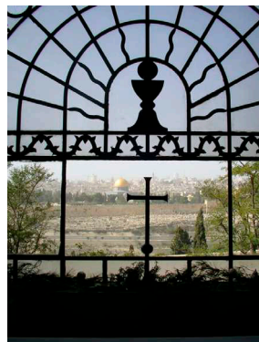
Blick vom Ölberg in Jerusalem auf den Tempelberg mit dem Felsendom