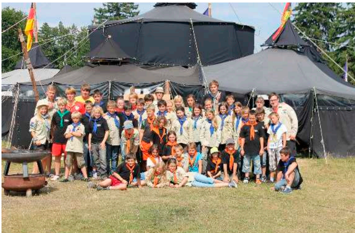
Die Georgspfadfinder vom Stamm Wikinger in Esslingen stehen hier vor der Jurtenburg des Bezirks Neckar-Filder. An den Halstuchfarben erkennt man die verschiedenen Altersstufen.